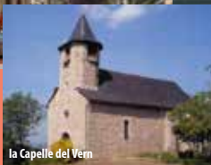
la Capelle del Vern